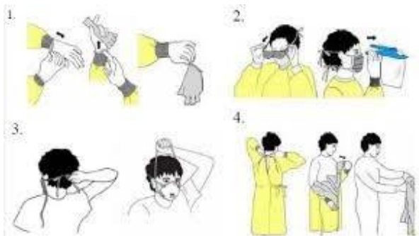
Fig. 1 - Ordem de remoção do equipamento de proteção individual

• NÃO SAIA DA ZONA DE ISOLAMENTO COM O EQUIPAMENTO DE PROTEÇÃO INDIVIDUAL. Deve retirá-lo e rejeitá-lo para um contentor de lixo com saco branco que se encontra no local e, em seguida, higienizar as mãos com solução alcoólica.